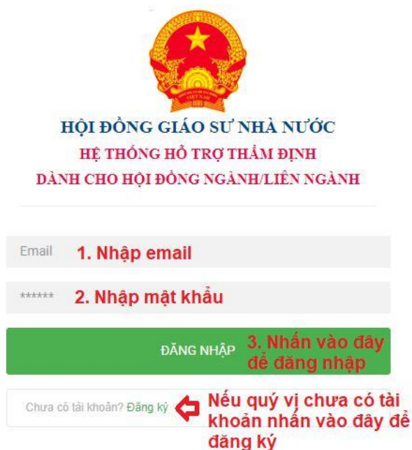
Hình 1. Giao diện đăng nhập vào hệ thống