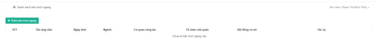
Hình 4. Giao diện sau khi đăng nhập vào hệ thống