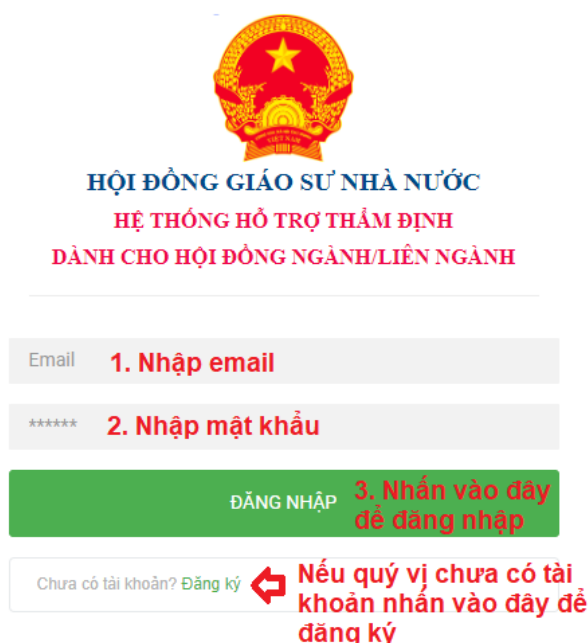
Hình 1. Giao diện đăng nhập vào hệ thống